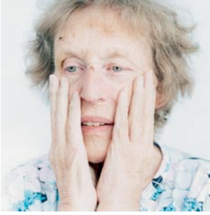
Portrait 3, 2001